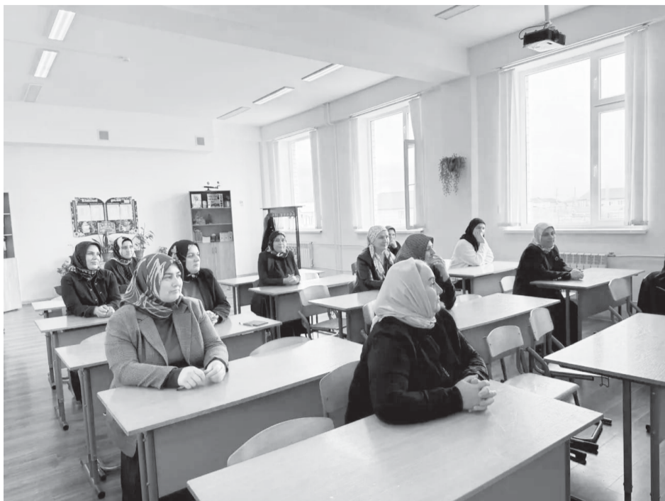
Ежегодная всероссийская акция «Сдаем вместе. День сдачи ЕГЭ родителями» стала доброй традицией, призванной помочь выпускникам и их родителям справиться с волнением перед одним из самых важных испытаний в жизни – Единым государственным экзаменом.

Шелковскому муниципальному району активно поддерживают эту акцию и снижают уровень стресса инициативу, организацию мероприятия на базе пункта проведения экзаменов.