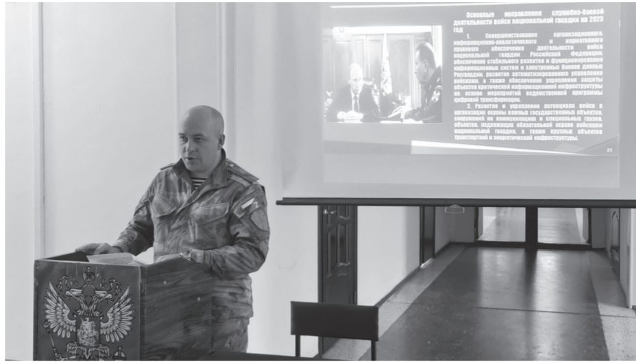
Щим напомнили требования безопасности при занятиях физической культурой и спортом, на занятиях по огневой, тактической и медицинской подготовке, а также меры безаварийной эксплуатации на войсковом и личном транспорте.

Зимний период подготовки завершится в мае контрольной проверкой, на которой будет оценено состояние боевой готовности, воинской дисциплины, вооружения и военной техники, а также уровень профессионально-должностной и физической подготовки личного состава соединения.